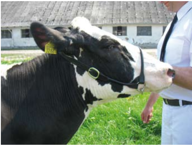
Prezenterka zbyt duża