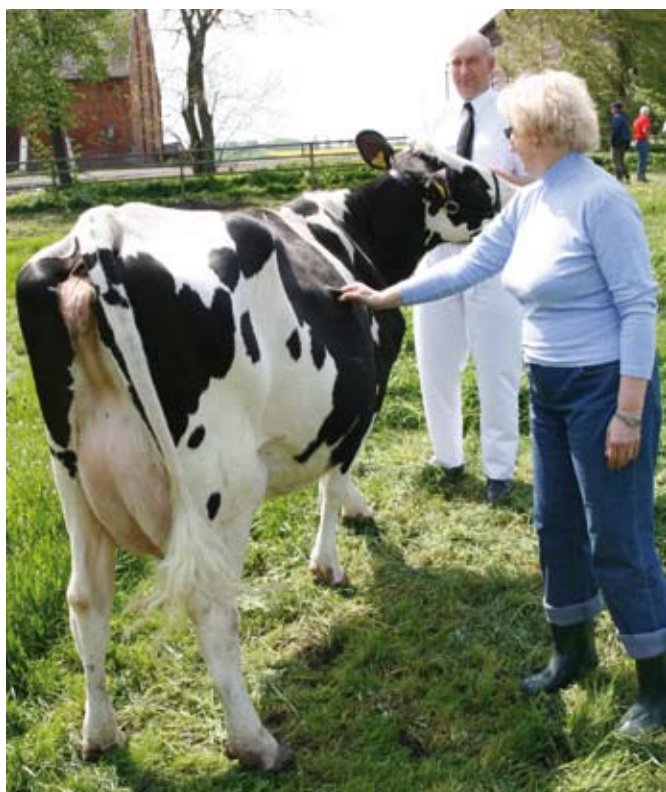
Sędzia ocenia delikatność skóry

Potem sędzia może spróbować delikatność skóry w celu oceny charakteru mlecznego. W tym momencie należy odrobinę zwrócić głowę jałówki w stronę sędziego, aby zmniejszyć napięcie skóry na prawym boku.