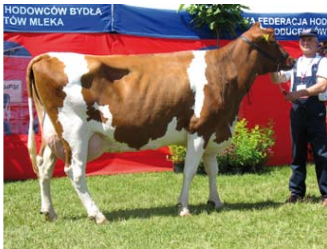
Nieprawidłowe ustawienie kończyn – niekorzystne skrócenie partii brzucha

Podczas całego procesu szkolenia jałówki trzeba z nią postępować konsekwentnie i być niewzruszonym oraz pamiętać, że nie jest ona szczeniakiem - pieszczochem. Rozpieszczona jałówka potrafi ze swojego prowadzącego zrobić niezłego głupca na ringu.