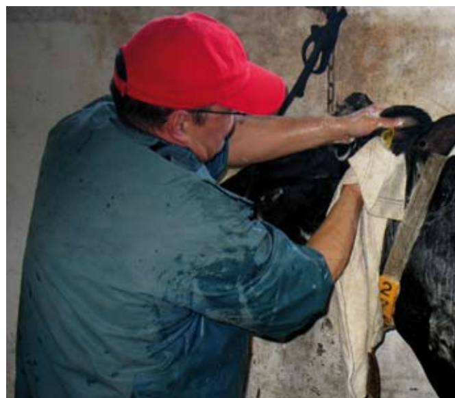
Mycie małżowiny usznej to delikatna operacja

Do mycia używamy szamponu dla zwierząt lub płynu do mycia naczyń. Należy go nałożyć na całą linię grzbietu, po czym rozprowadzić stopniowo po całym ciele mokrą szczotką ryżową, nie wyłączając nóg, podbrzusza i innych trudno dostępnych partii ciała jak mostek i pachwiny.