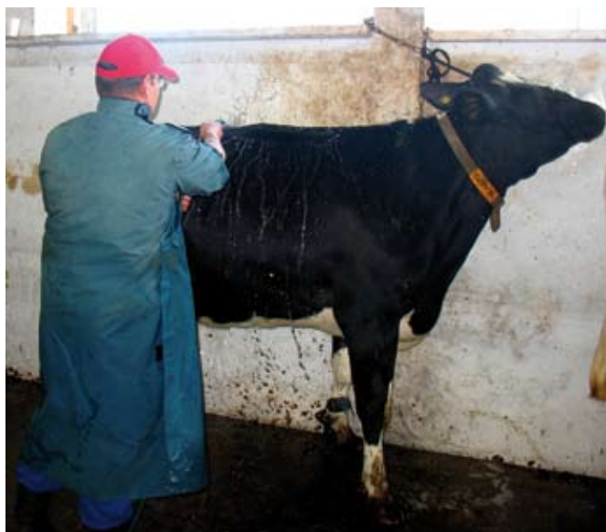
Zanim przystąpimy do mycia jałówkę trzeba bardzo dokładnie zmoczyć wodą