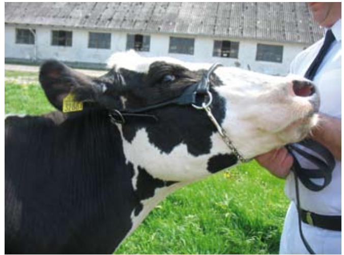
Prezenterka za mała