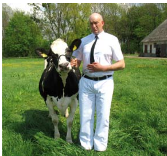
Prawidłowo ubrany oprowadzający

Wprowadzając zwierzę na ring oprowadzający po- winien być ubrany starannie, czysto i schludnie. Utrzy- manie czystości białej odzieży przed wyjściem na ring może nie być łatwe, dlatego dobrze jest mieć kom- binezon ochronny, który można zdjąć przed samym wyjściem na ring.