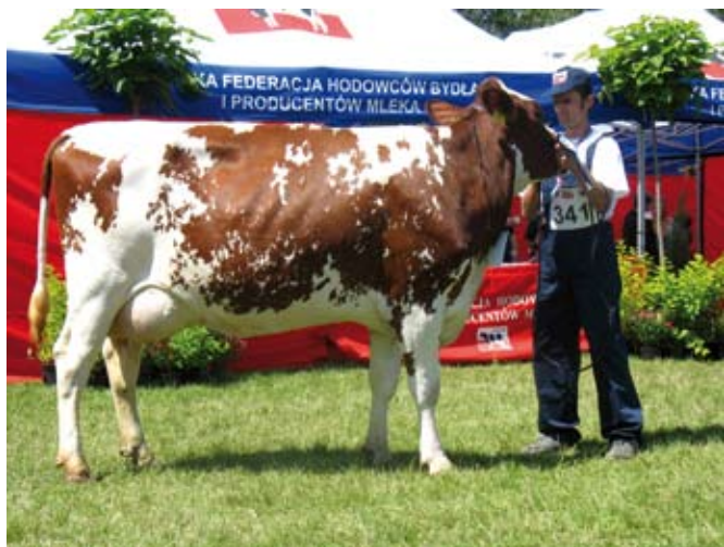
Prawidłowe ustawienie kończyn

Niezwykle trudnym zadaniem jest nauczyć zwierzę prawidłowo ustawiać nogi w pozycji stojącej nieruchomo. Gdy sędzia znajduje się wewnątrz ringu prawidłowo prawa tylna noga jest wystawiona lekko do tyłu, a lewa przednia noga odrobinę za prawą przednią nogą.