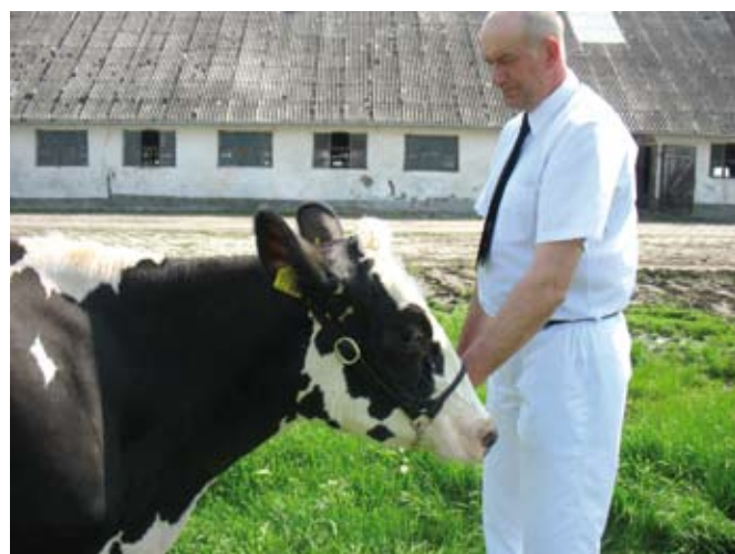
Głowa trzymana zbyt nisko

Sędzia, oceniając uczestników konkursu, wyrabia sobie zdanie o ich umiejętnościach prosząc ich kilkakrotnie o zatrzymanie się lub kontynuowanie marszu wokół ringu.