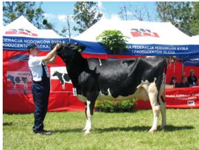
Zbyt wysoko trzymane ręce sprawiają, że głowa jest nienaturalnie uniesiona