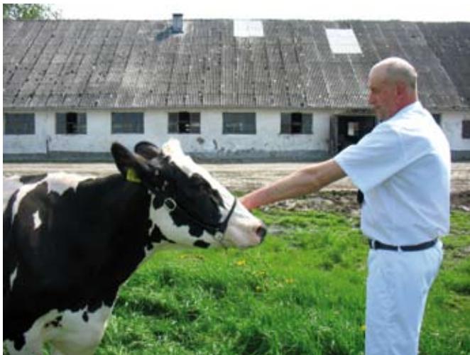
Lewa ręka za mocno wyprostowana

Ramię powinno znajdować się na takiej samej wysokości co głowa jałówki, łokieć lekko ugięty, nie za mocno wyprostowany i nie uniesiony za wysoko. Przedramię osoby prowadzącej stanowi przedłużenie linii głowy zwierzęcia.