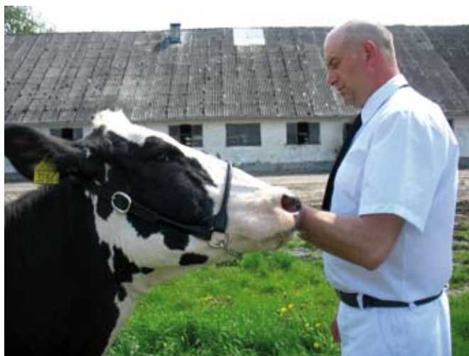
Prawidłowa pozycja ramienia trzymającego presenterkę

Ważną sprawą jest ocenić mocne i słabe strony jałówki.