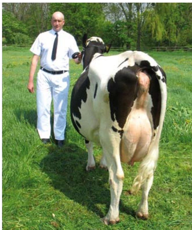
Prawidłowy sposób prezentowania zwierzęcia od tyłu