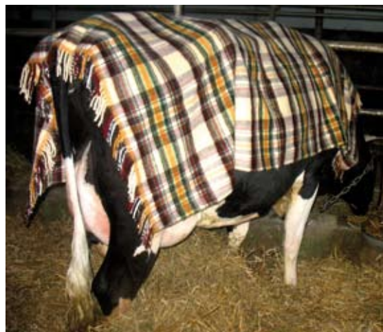
Jałówki są znacznie bardziej wrażliwe na wyziębienie niż krowy

Jeśli mycie odbywa się w okresie zimowym, po umyciu jałówkę dobrze jest okryć kocem lub derką i nigdy nie stawiać jej w przewiewie. Pamiętać trzeba, że młode zwierzęta są szczególnie nieodporne na wyziębienie, krowy znoszą mycie znacznie lepiej, jeśli ogłędnie i delikatnie postępujemy przy myciu wymienia.