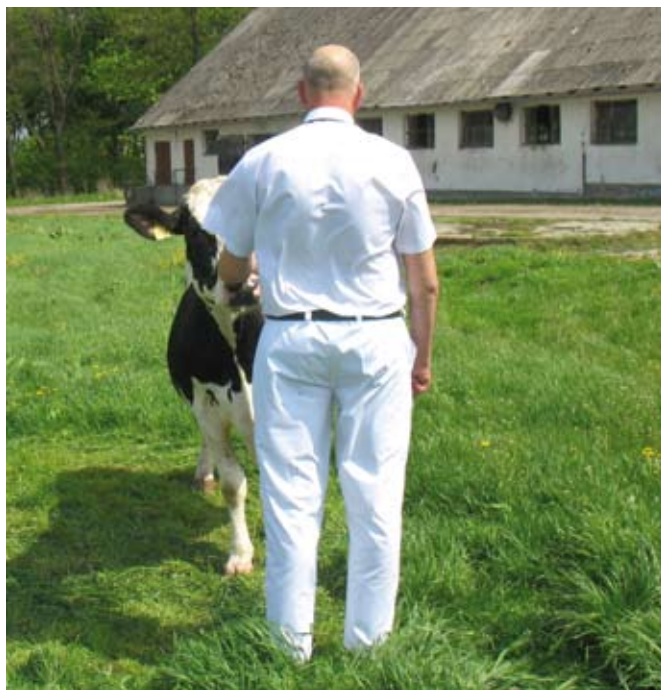
Nieprawidłowo prezentowany przód jałówki

Następnie sędzia obchodzi jałówkę oglądając ją z tyłu, ocenia wtedy wygląd linii grzbietu od ogona do głowy. Oprowadzający powinien wówczas skupić się na tym, czy jałówka jest wyprostowana, nie zgarbiona i jej głowa jest zwrócona do przodu.