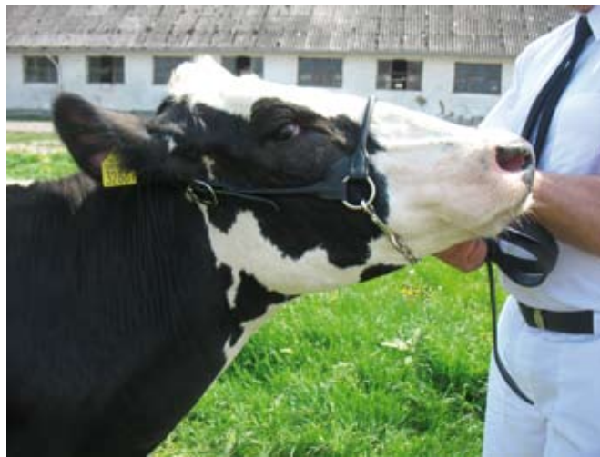
Prawidłowo dopasowana prezenterka

Twoja lewa ręka powinna ściśle przylegać do głowy cielęcia, bo wówczas kantarka nie wchodzi jej do oka, a gdyby jałówka nie była trzymana dość mocno, przeraziła się nagle i zaczęła skakać do tyłu – prezenterka prawdopodobnie zostanie nam w ręce.