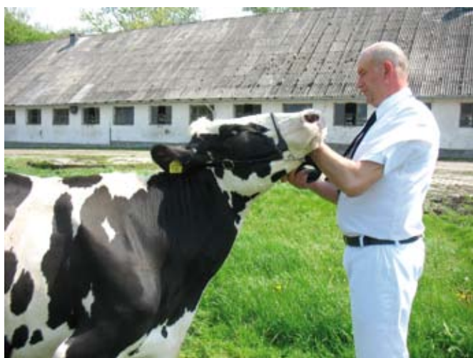
Głowa trzymana zbyt wysoko

Za szczególnie niegrzeczne jest uważane takie postępowanie, jeśli zaczynasz tworzyć wewnętrzny pierścień bliżej środka ringu, zasłaniając inne jałówki i uniemożliwiając sędziemu ich ocenę. To może być powodem do zdyskwalifikowania cię na ringu!