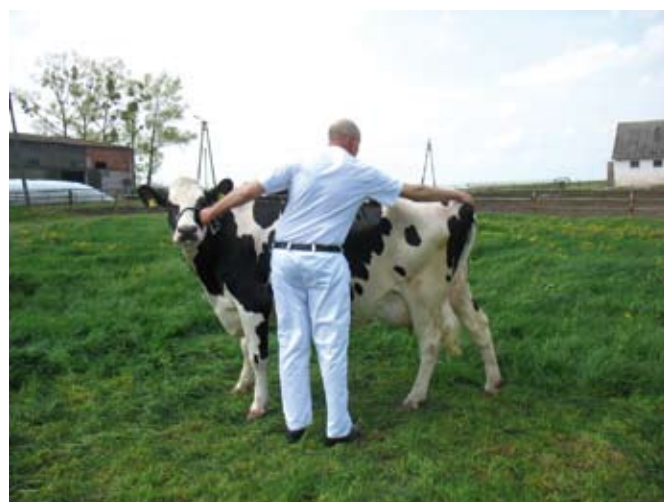
Sposób wyprostowania grzbietu i repozycji ogona

Po zakończeniu indywidualnej oceny każdej jałówki, sędzia zaczyna ustawiać zwierzęta w linii na środku ringu. Jeśli otrzymamy sygnał, aby podejść, trzeba szybko przeprowadzić zwierzę energicznym krokiem we wskazane miejsce w tworzonej linii.